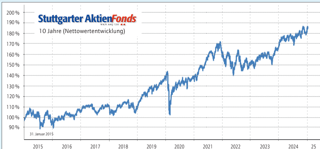
Der Kurswert am 31.01.2015 mit 78,98 Euro entspricht 100 Prozent auf der Prozentachse (Ordinate). Achtung: Entwicklungen in der Vergangenheit stellen keinen zuverlässigen Indikator für die zukünftige Wertentwicklung dar und bieten keine Garantie für einen Erfolg in der Zukunft.

Bei der Darstellung handelt es sich um eine Nettowertentwicklung, die bereits folgende pauschalisierte Gebühren berücksichtigt: einmalige Gebühren zum Zeitpunkt des Kaufs und des Verkaufs in Höhe von jeweils 1,5 % (inklusive Bank- und Maklergebühren wie Courtage und Spread (Differenz zwischen dem Kauf- und dem Verkaufskurs)). Darüber hinaus können Depotkosten die Wertentwicklung zusätzlich mindern. Die zugrunde liegenden Kurse (in Euro) entsprechen dem täglich von der Verwaltungsgesellschaft IPConcept (Luxemburg) S.A. festgestellten Kurswert.